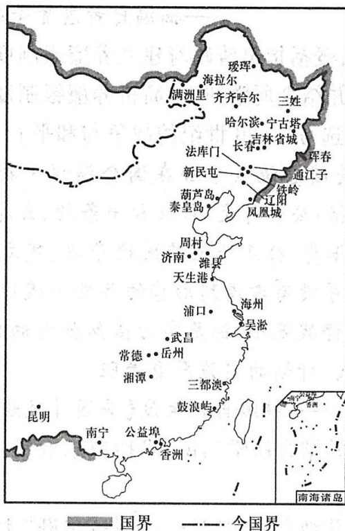
清末自开商埠分布示意图