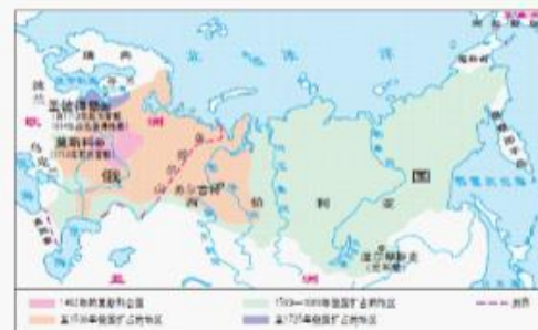
俄国在欧洲和亚洲的领土扩张(至19世纪初)