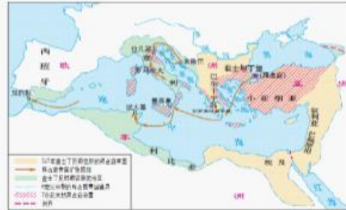
6-7世纪的拜占庭帝国