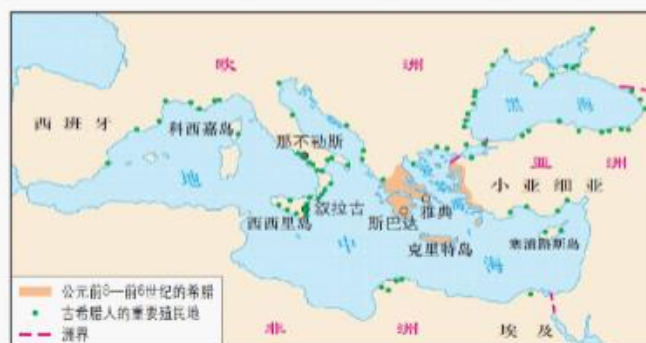
古希腊人在地中海和黑海地区的殖民示意图