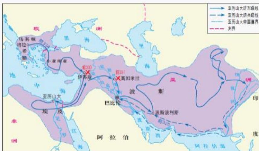
亚历山大帝国形势图