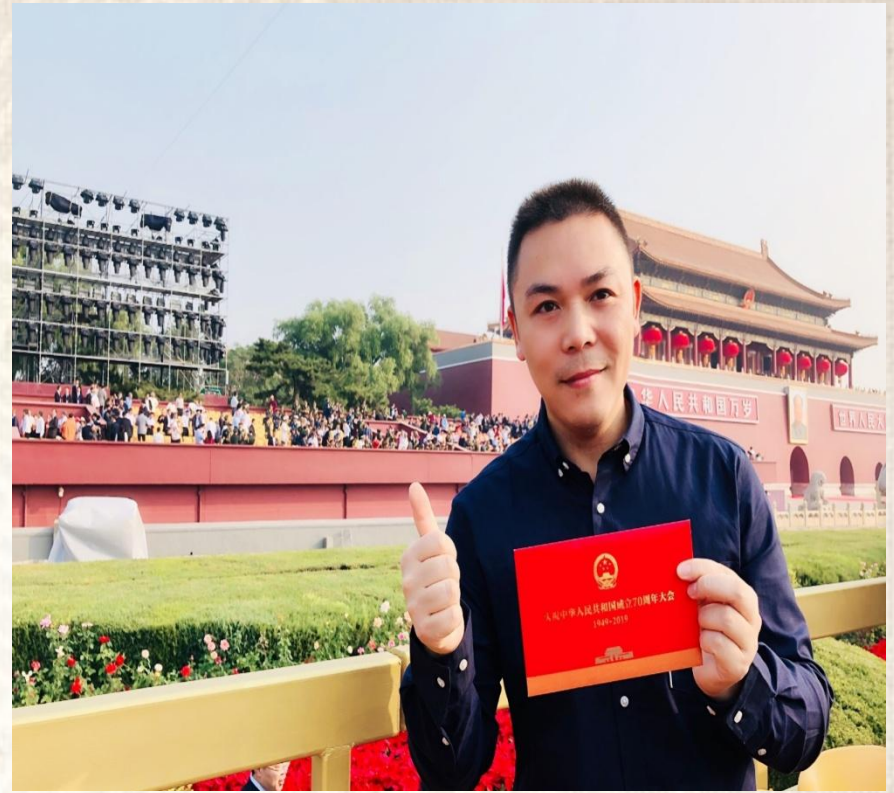
2019年中华人民 共和国成立70周年 大阅兵