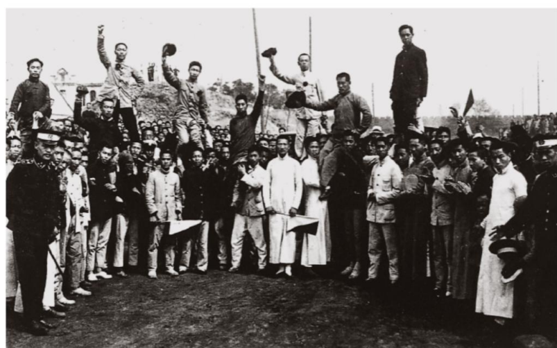
北京高师被捕学生回校时受到热烈欢迎