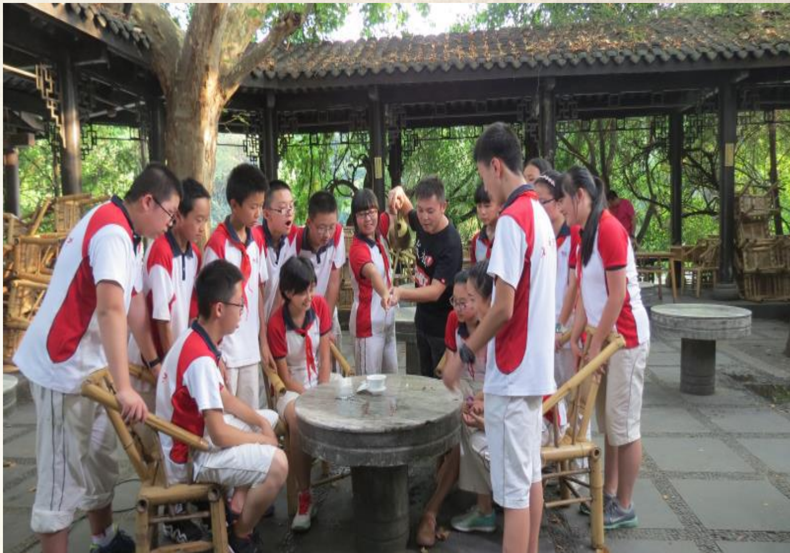
在成都人民公园讲：四川民俗文化