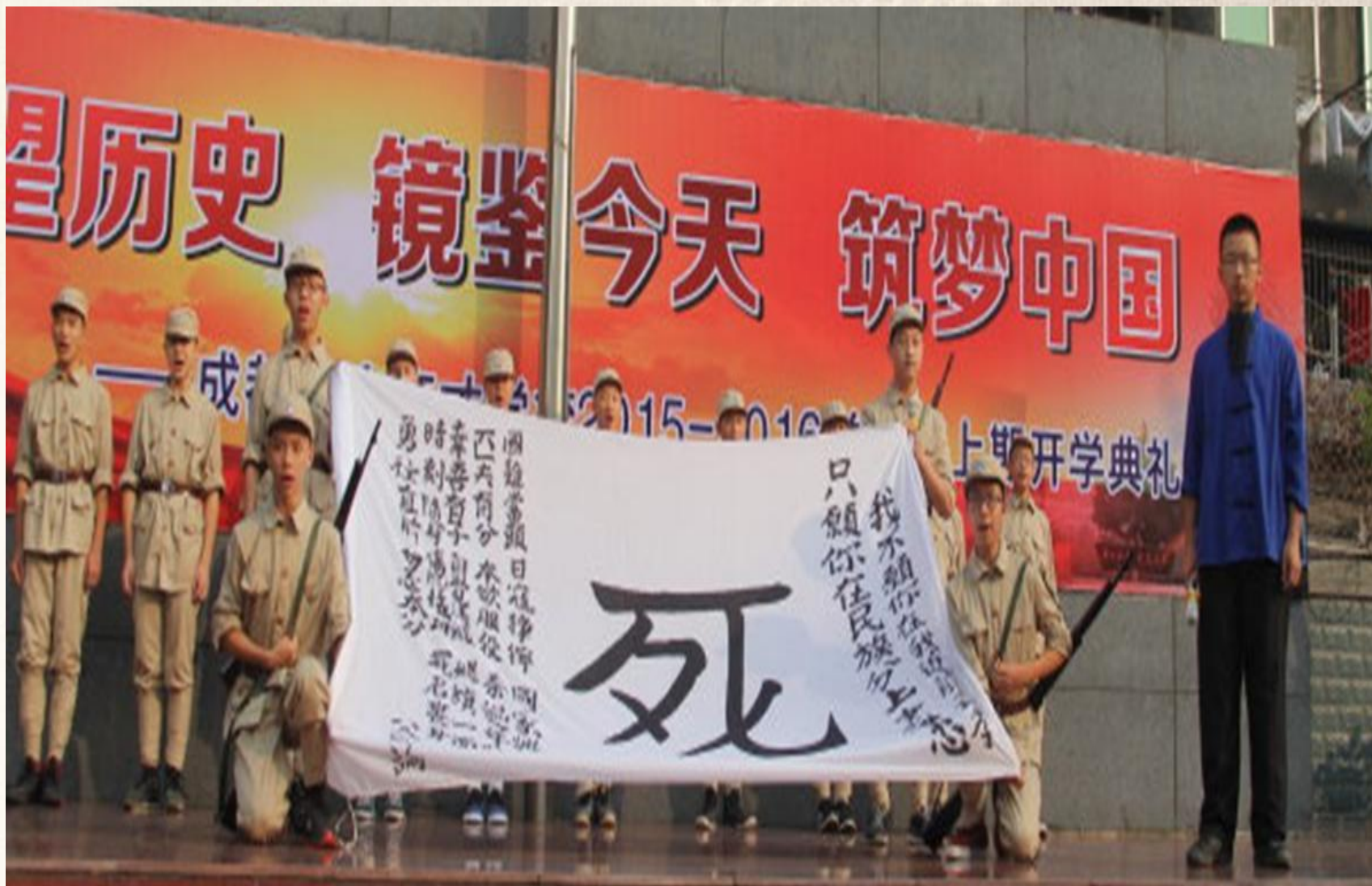
学校的开学典礼组织学生表演壮士出川