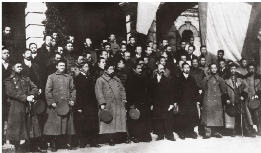
孙中山就任中华民国临时大总统