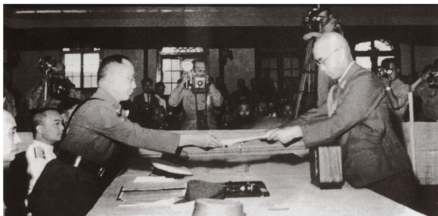
何应钦（左）代表中国接受日军投降书