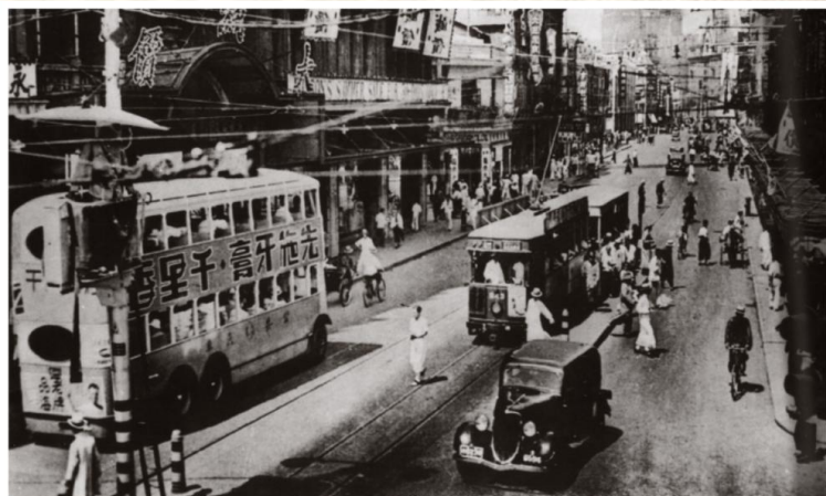
上海街道上行驶的有轨电车