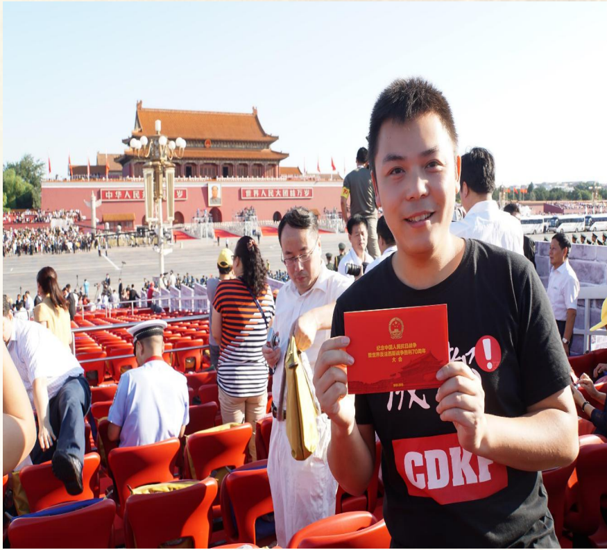
2015年纪念世界反法西斯 战争胜利暨中国人民抗日战 争胜利70周年大阅兵