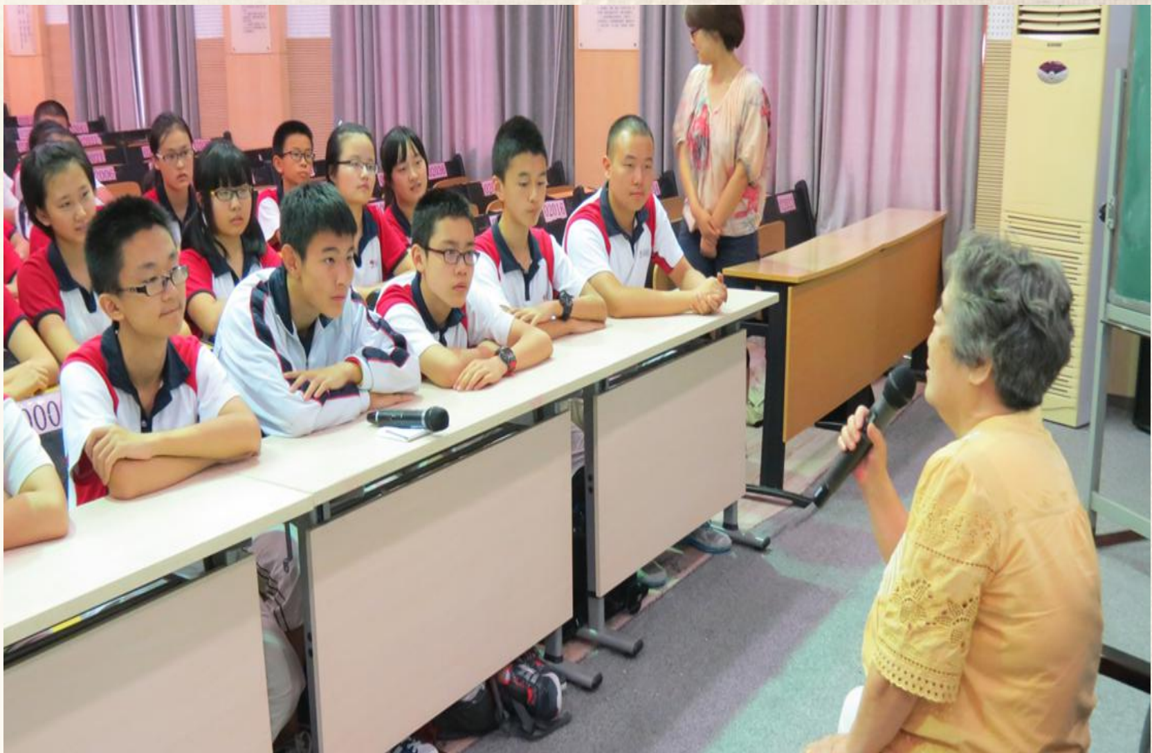
请经历了日军大轰炸的老奶奶讲历史