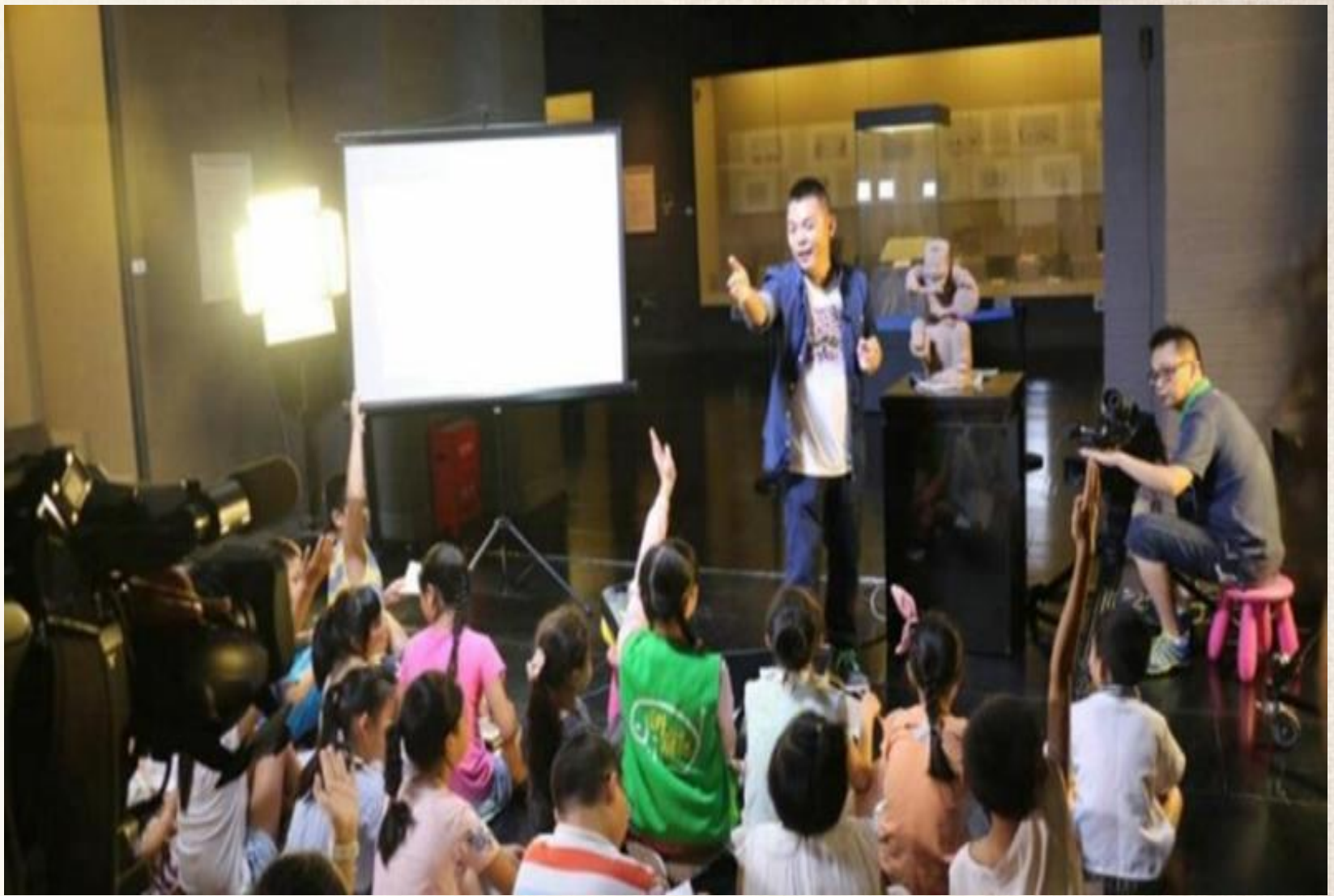
在四川省博物馆讲：四川汉代画像砖