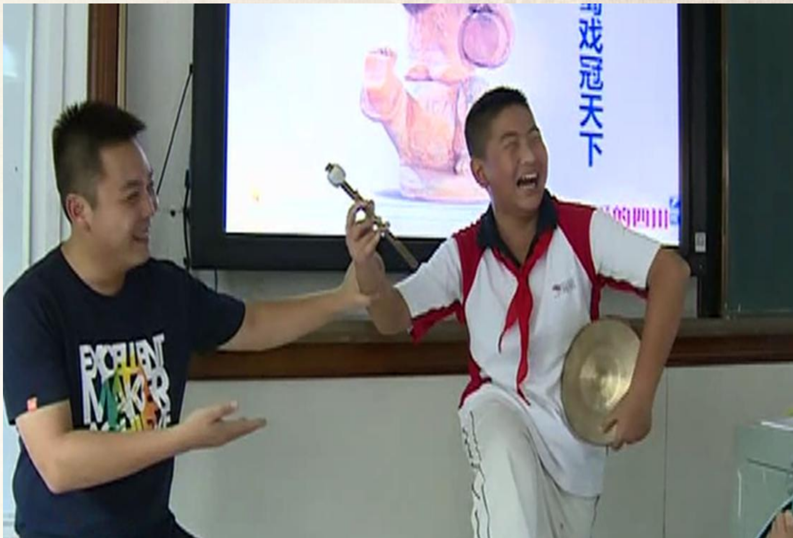
学生课堂进行文物模仿