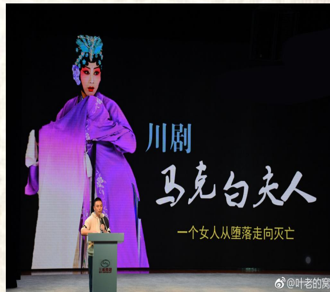
与川剧名家合作开展十余场“边演边讲”川剧普及活动