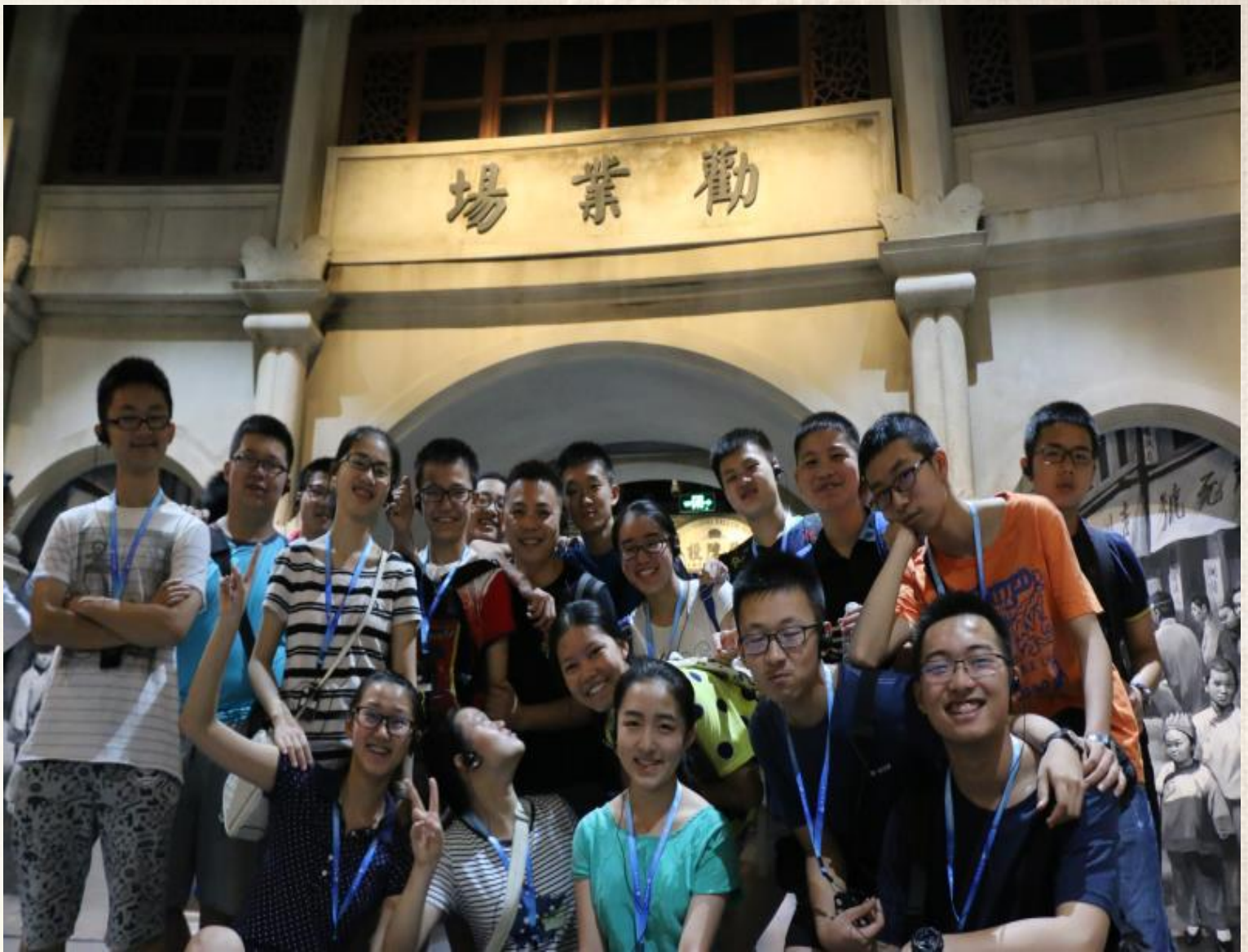
在成都博物馆讲：成都历史