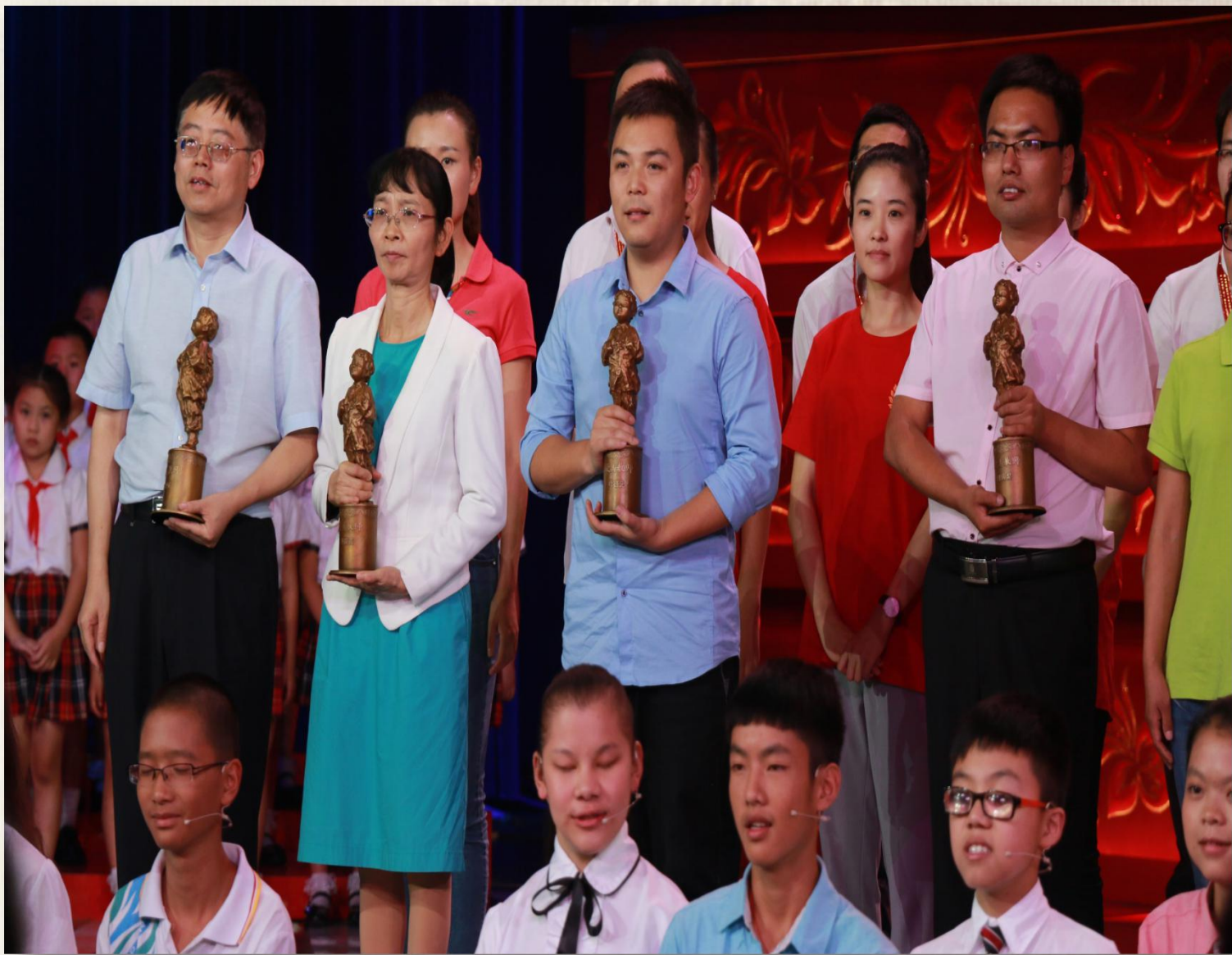
2015年获得全国十佳最美教师