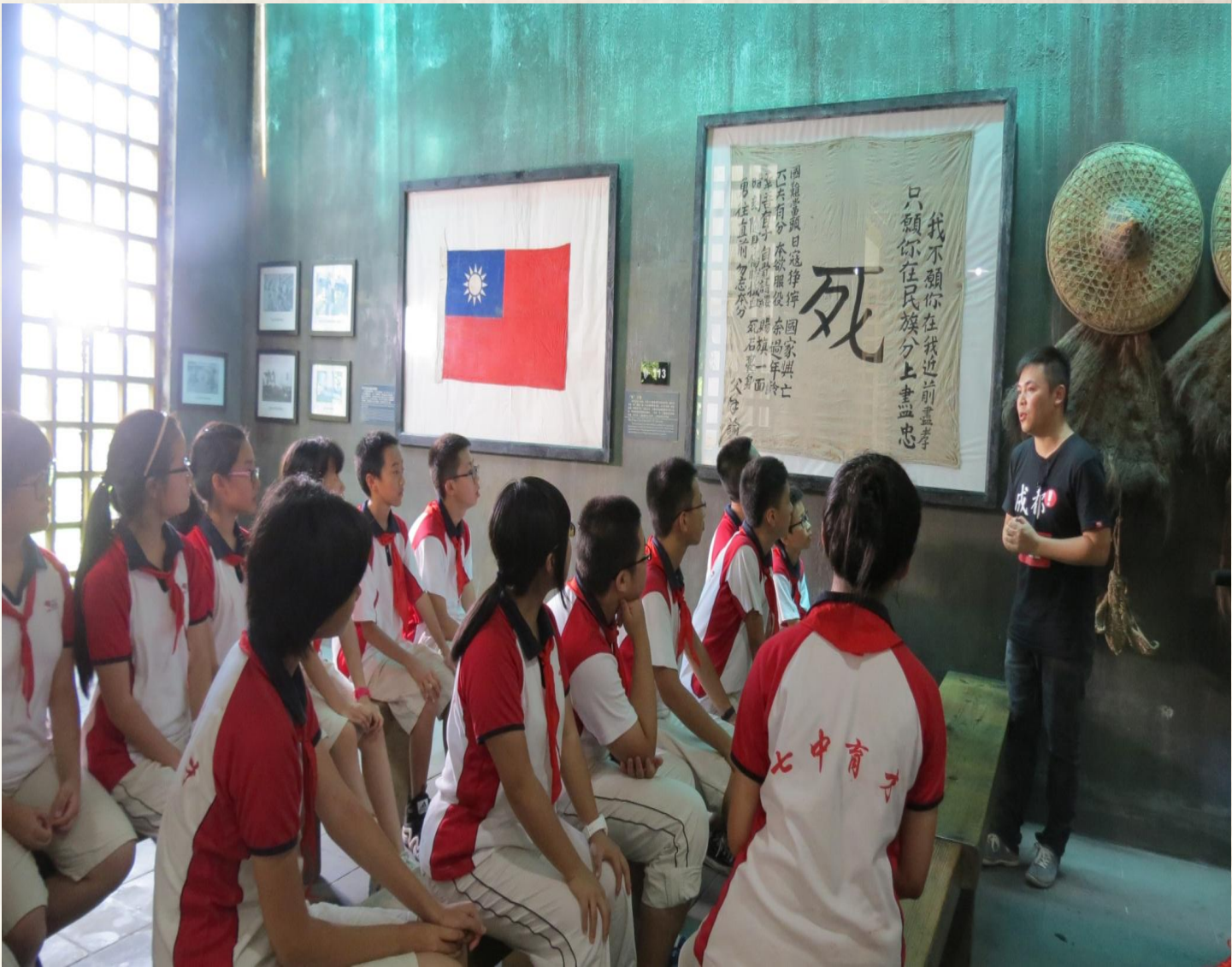
在建川博物馆“死字旗”前讲川军抗战